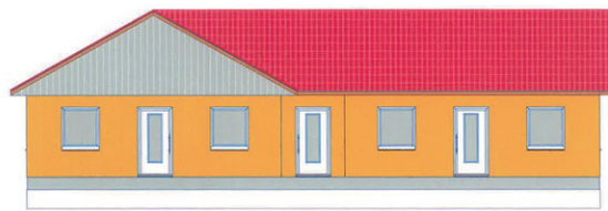
Ansicht Haus 1 und 2 Hauseingangsseite

Sie haben jetzt Interesse an solch einer Wohnung und möchten mehr Details erfahren. Dann sprechen Sie unser Vermietungsteam an unter Tel.: 03464 2434-0 oder schreiben eine E-Mail an: vermietung@swg-sangerhausen.de .